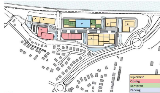
FIG 3 Voorontwerp inplantingsplan